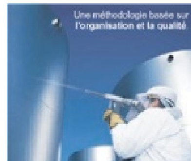
Une méthodologie basée sur l'organisation et la qualité.

En 2006, compte tenu de la puissance fonctionnelle et de la flexibilité de la solution IWS 2.7 en particulier la gestion du multi-instances qui est la capacité de décliner un nouvel écran à partir des écrans existants pour un même profil d'utilisateur, nous avons choisi d'étendre la solution IWS 2.7 à la gestion de notre parc d'environ 1550 véhicules.